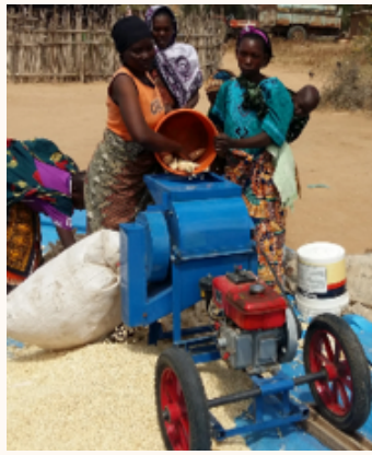
Njia bora inayofaa